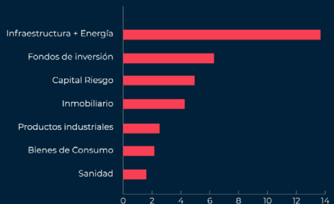
Figura 2. INVERSIONES FSI POR INDUSTRIA ($M)