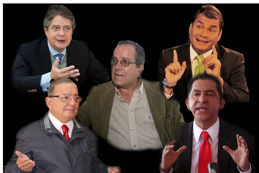
Los cinco candidatos presidenciales que ocupan los primeros lugares en las encuestas de intención de voto de los ecuatorianos: Rafael Correa, Guillermo Lasso, Lucio Gutiérrez, Alberto Acosta y Álvaro Noboa

El poder comunicacional del Gobierno actual ha permitido que en los últimos meses se intensifique la puesta en valor de las obras realizadas por el régimen a través, por ejemplo, de la emisión de cadenas nacionales de hasta una hora de duración para transmitir la inauguración de un centro para fortalecer el control de la seguridad ciudadana en Quito (ECU 911). Gracias a recursos como éste se ha conocido de forma anticipada y reiterada que, de acceder a un nuevo mandato presiden-